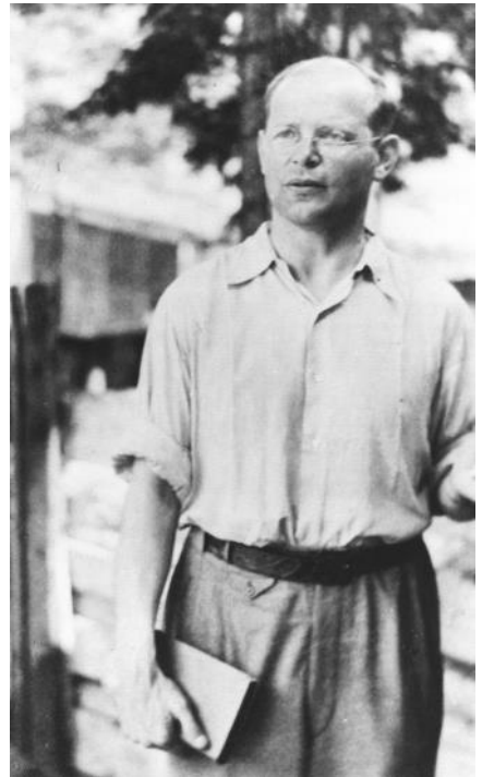
Dietrich Bonhoeffer