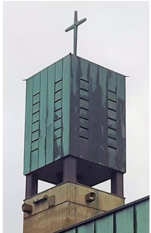
Nistkästen am Kirchturm der Andreaskirche

Nach diesem Vorbild wurden vor Jahren schon am Kirchturm der Andreaskirche und am Gemeindehaus in Babenhausen einige gut genutzte Nistgelegenheiten angebracht u.a. für Falken, Dohlen, Stare, Sperlinge und Mauersegler (die allerdings bisher ausgeblieben sind). Auch der Kirchturm der Markuskirche ist bei den Falken beliebt. Und dann und wann landet auch der eine oder andere Storch bei uns auf dem Kreuz auf der Andreaskirche.